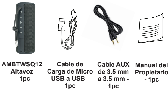
AMBTWSQ12 Altavoz - 1pc Cable de Carga de Micro USB a USB - 1pc Cable AUX de 3.5 mm a 3.5 mm - 1pc Manual del Propietario - 1pc